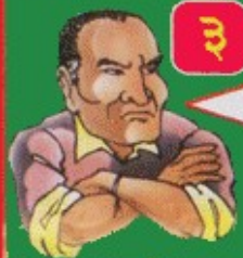
क्षुब्ध र अल्झे कृषक